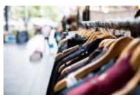
@libre de droits